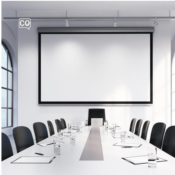
La sala de reuniones

? https://espanol.colangue.fr/plan-de-cours/a2/42